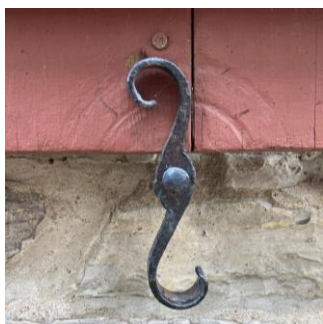
Arrêt de volet double volute

Bien que nous ayons des contrevents, les pièces de quincaillerie en fer forgé qui servent à les retenir porte des noms tels que bloque-volet ou arrêt de volet . Voici quelques modèles :