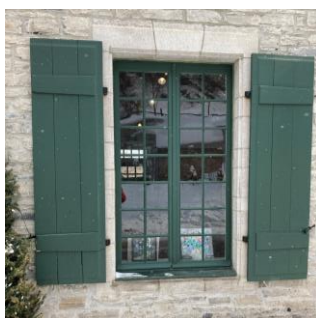
Contrevent sur le maison Paradis