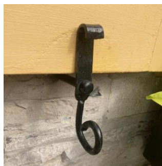
Arrêt de volet simple volute