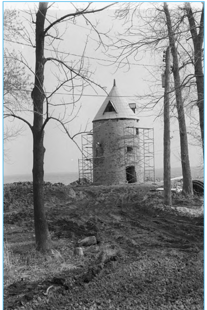
Rénovation du moulin de l'Île Perrot, 1977