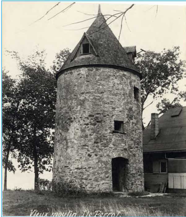
L'Île-Perrot - Le moulin à vent, [Vers 1925], BAnQ Québec, Collection initiale, (03Q,P600,S6,D5,P509)