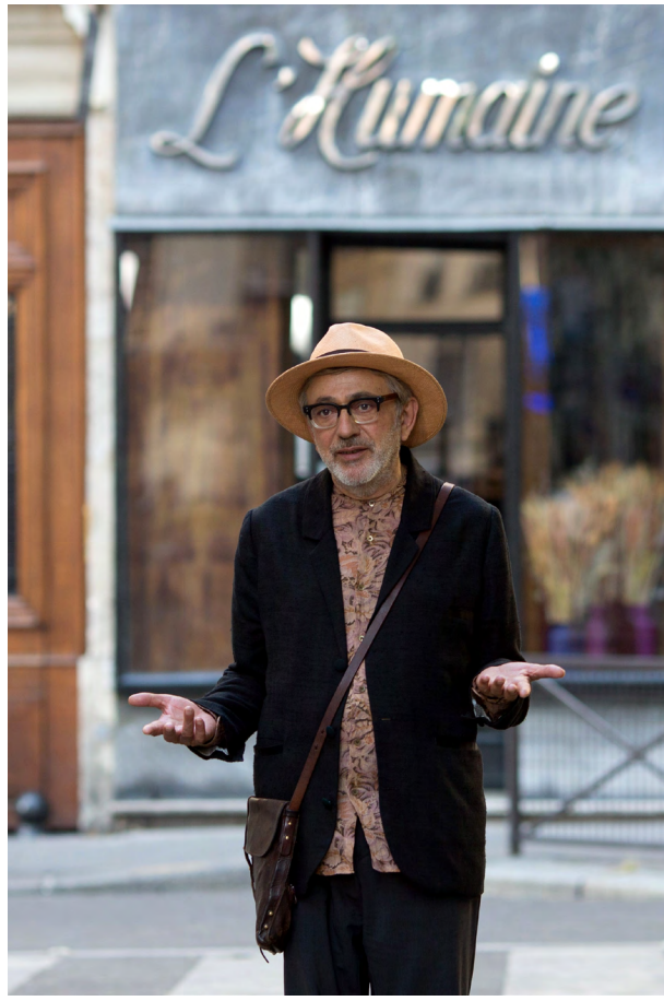
It Must Be Heaven d'Elia Suleiman Coproductio France, Québec, Allemagne et Turquie