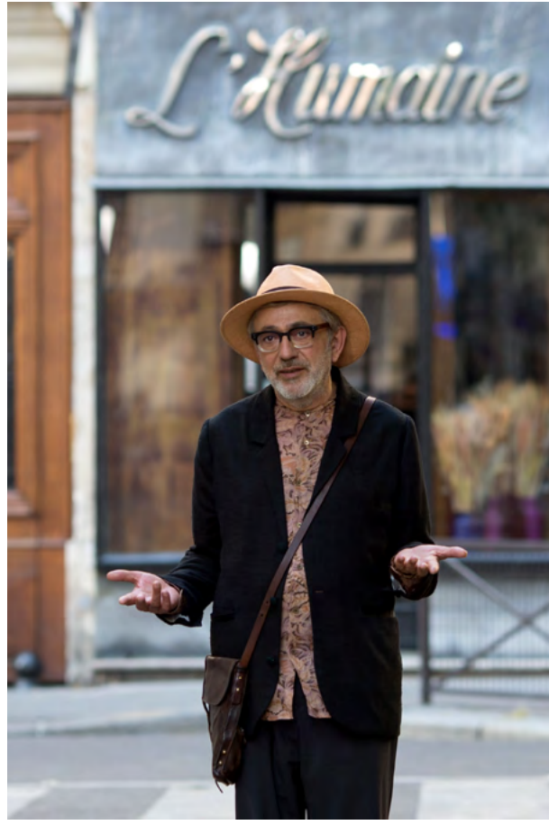
It Must Be Heaven d'Elia Suleiman Coproductio France, Québec, Allemagne et Turquie