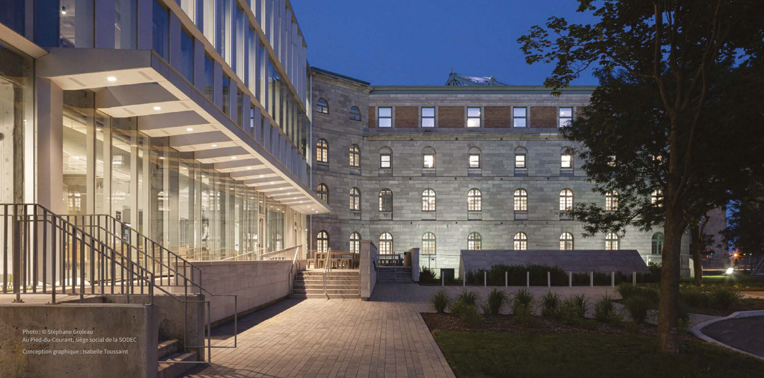
Au Pied-du-Courant, siège social de la SODEC Conception graphique : Isabelle Toussaint